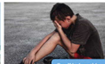
Perdió el partido.