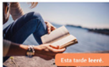
Esta tarde leeré.

Palabras que expresan acciones y que indican: