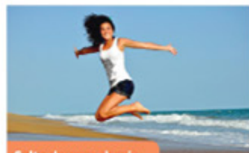
Salta de pura alegría.