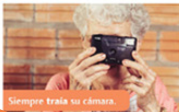
Siempre traía su cámara.